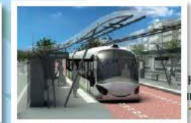
HYKE innitelma 12