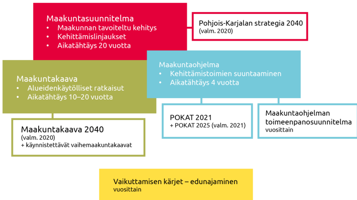
Kuva 2. Maakunnan suunnittelujärjestelmä.