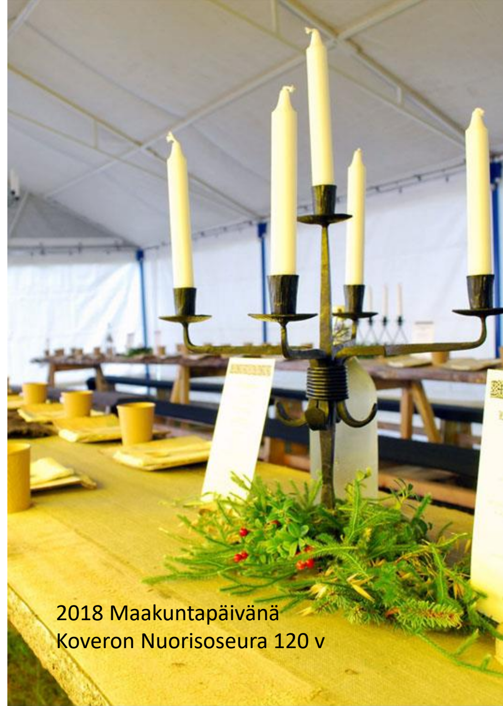
2018 Maakuntapäivänä Koveron Nuorisoseura 120 v